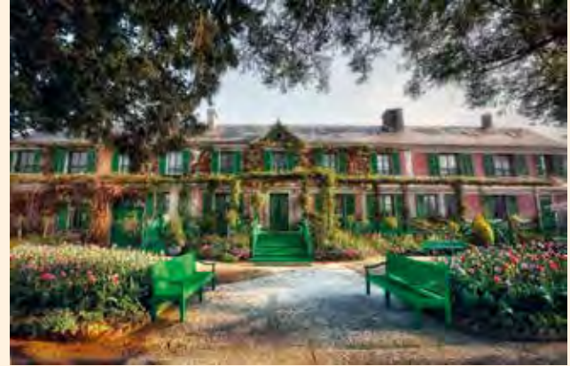
Foto: Haus und Garten von Claude Monet, Giverny